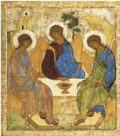
Андрей Рублёв «Троица», 1411 год или 1425-27

Римской империи было жизненно ВАЖНО ОТДЕЛИТЬ христианство от иудаизма — создать между ними непреодолимую разницу. Это можно было сделать только через объявление Христа Богом. Но так объявить, чтобы не отрицать иудаизм. Иначе можно было скатиться в язычество и отсебятину, и похоронить новую религию. На первый взгляд задача выглядит абсолютно нерешаемой. Тут снова можно сказать про безумство храбрых, творческая и интеллектуальная дерзость которых не знает границ. Технологи Римской